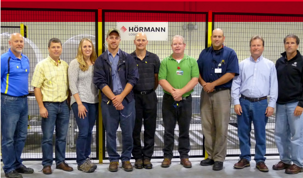
Green Bay Project Team

„In order to remain a viable option in our marketplace, we looked for means to increase speed and throughput, handle greater roll weights, maximize quality and minimize waste. HÖRMANN Logistik provided the internal expertise and a network of capable suppliers to enable us to realize a highly customized and efficient system.“