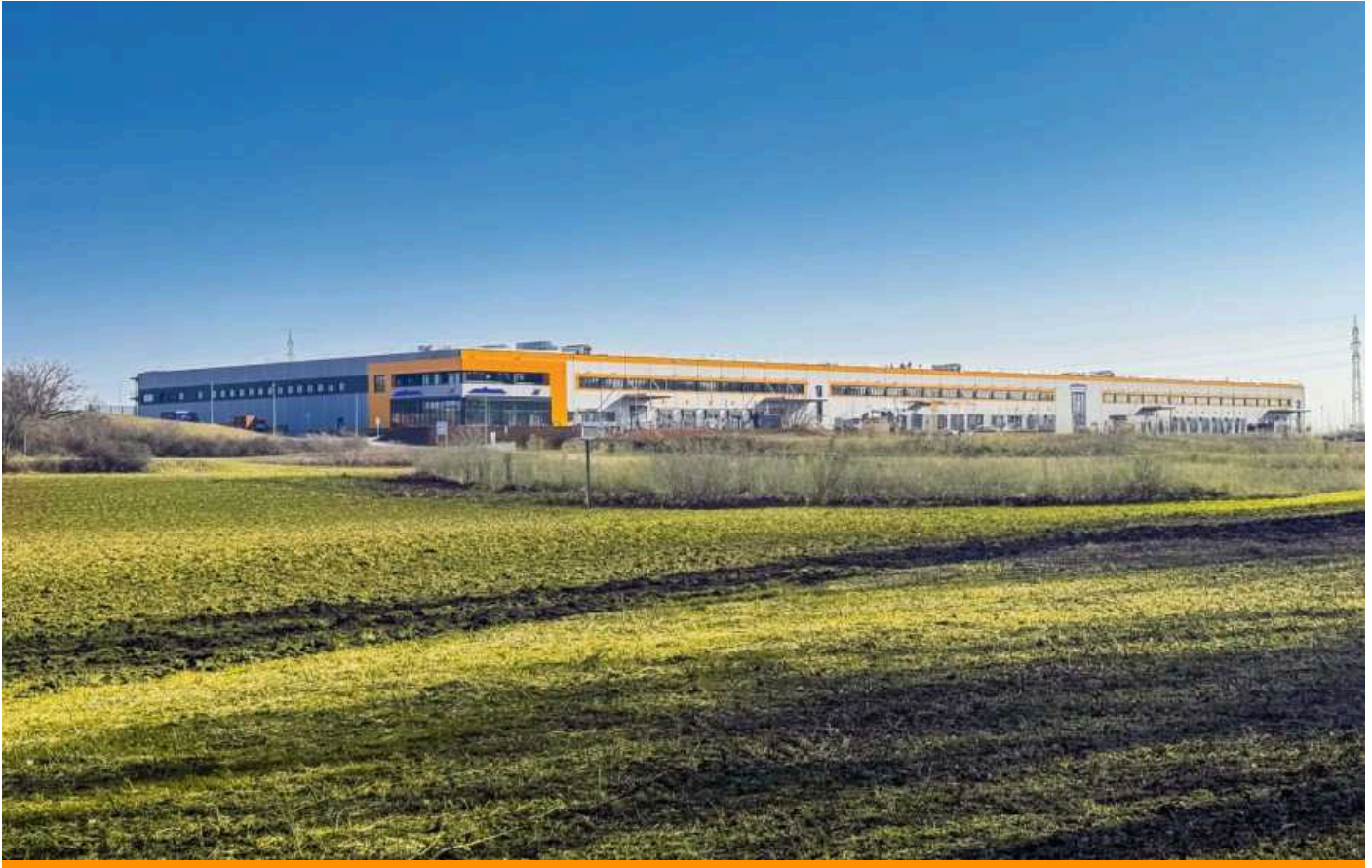
Schuon nimmt Wildberg II in Betrieb