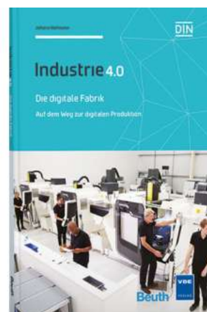
Die digitale Fabrik