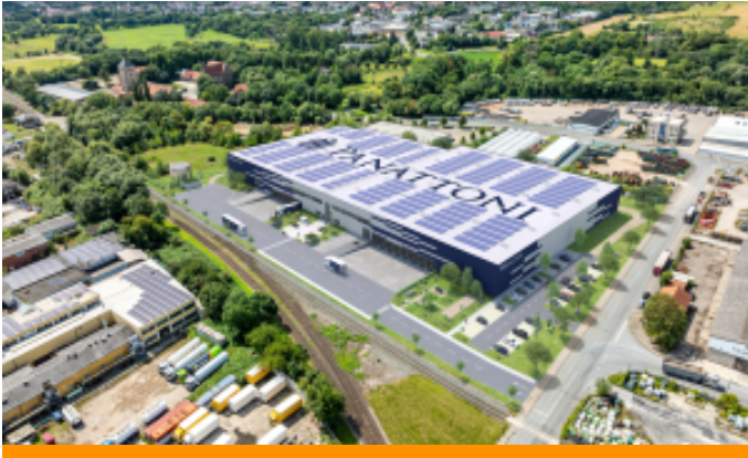
Brownfield-Entwicklung: Panattoni errichtet Logistikzentrum mit 16.880 Quadratmetern in Hildesheim