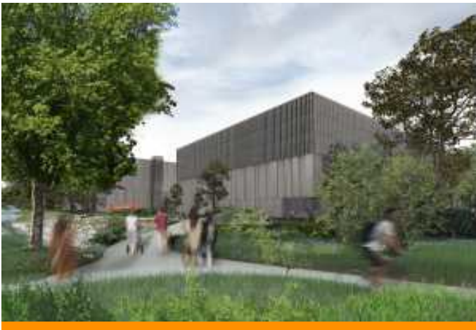
Logistikimmobilien: Gebrüder Weiss errichtet Logistik- und IT-Center in Wolfurt