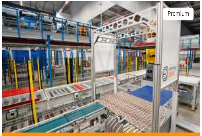
Empfindliche Produkte depalettieren