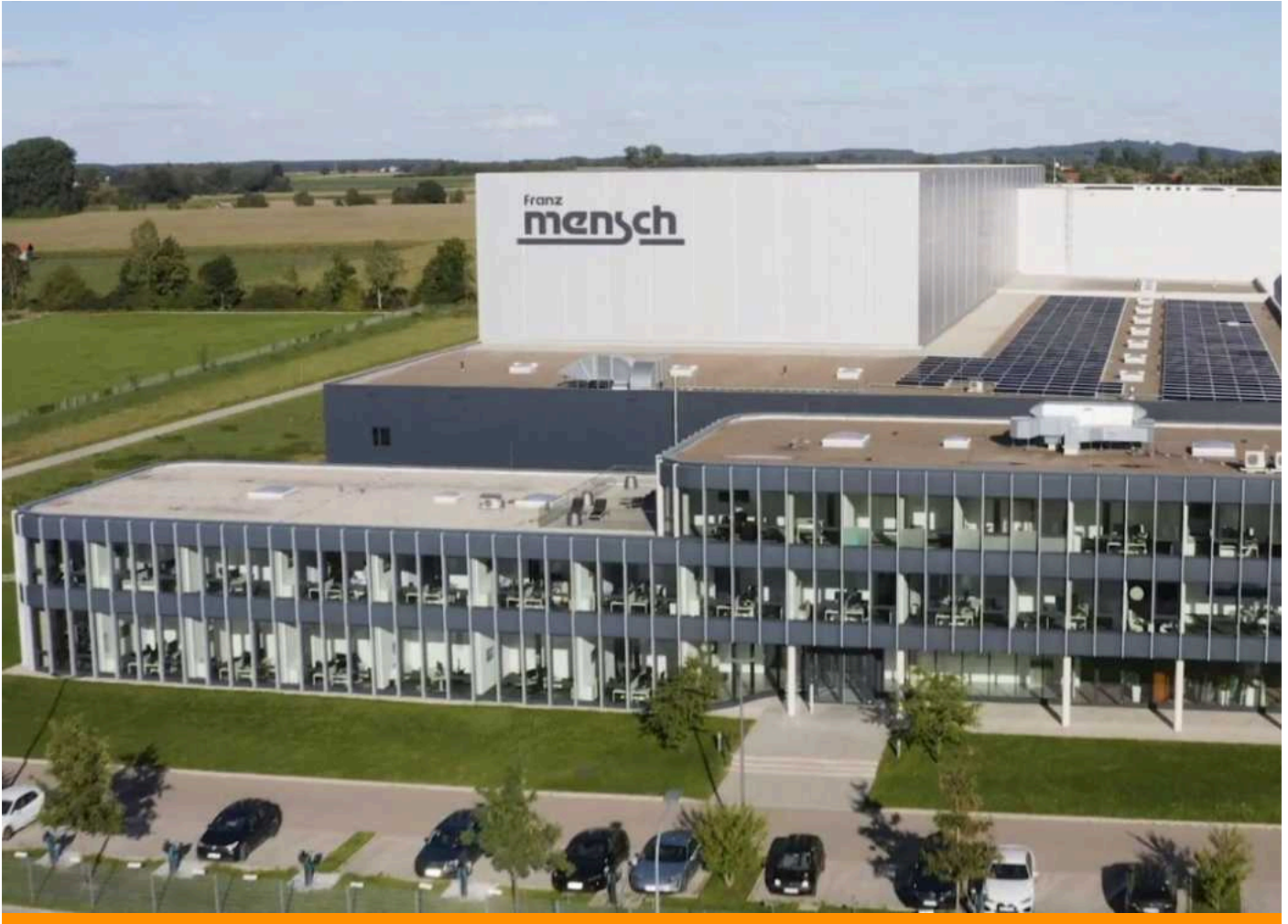
Das Firmengebäude der Franz Mensch GmbH in Buchloe wird um ein „AutoStore“-Lager erweitert.