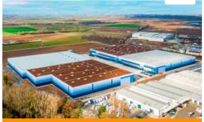
Brownfield-Projekt von GLP